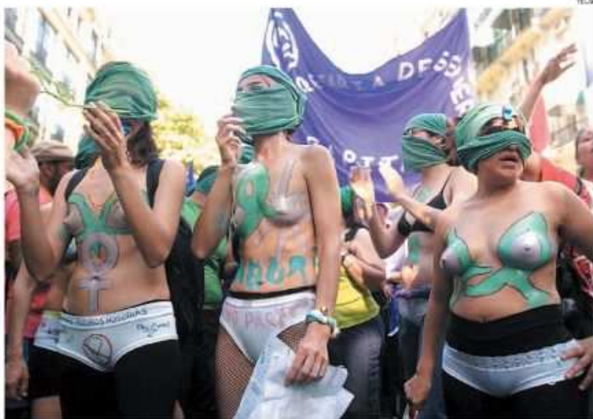
Marcha - En las manifestaciones a favor del aborto se remarca el derecho de la mujer a decidir.